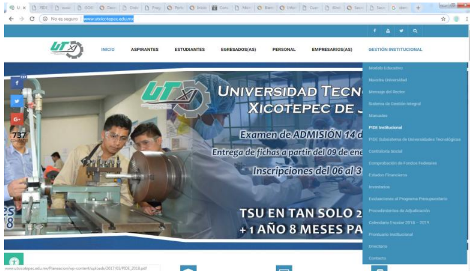
Ilustración 6. Página electrónica de la Universidad Tecnológica de Xicotepec de Juárez, menú Gestión Institucional.