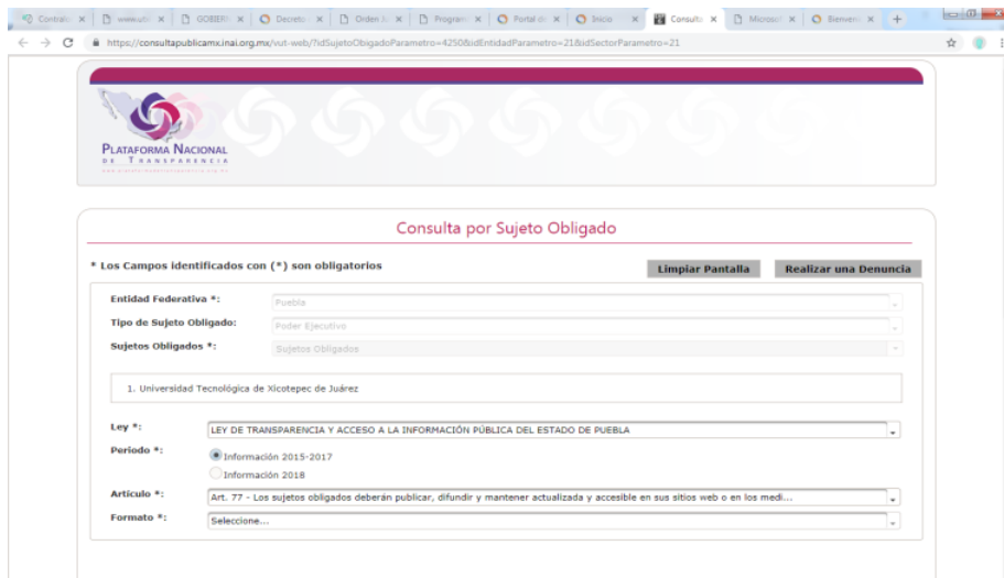
Ilustración 5. Plataforma Nacional de Transparencia. Artículo 77.

Aunque el Pp no cuenta con Reglas de Operación o con algún otro documento normativo referente al tema de transparencia y rendición de cuentas, se identificó que a través de la Plataforma Nacional de Transparencia 14 , en el artículo 77 fracción VI Indicadores de sus objetivos y resultados, difunde los principales resultados del programa, asimismo, en la fracción XXIX se encuentra el informe de actividades de la Universidad Tecnológica de Xicotepec de Juárez reportados por trimestres, de abril a diciembre.