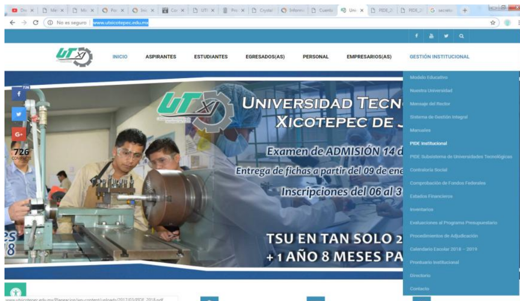
Ilustración 1. Programa Institucional de Desarrollo (PIDE) 2014-2018, menú “Gestión Institucional”.

Por lo que se recomienda establecer en el diagnóstico, la vinculación entre el propósito y los objetivos de la Matriz de Indicadores para Resultados (MIR) y el Programa Institucional de Desarrollo 2014-2018 de la Universidad Tecnológica de Xicotepec de Juárez.