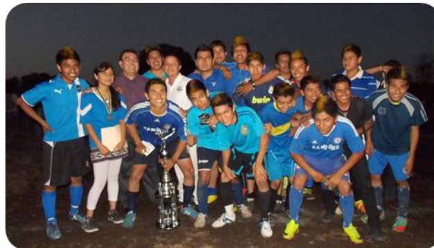
Torneo de Fútbol Soccer UTXJ