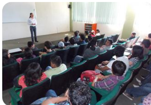
Conferencia "Importancia de vacunarse contra el virus del papiloma humano".