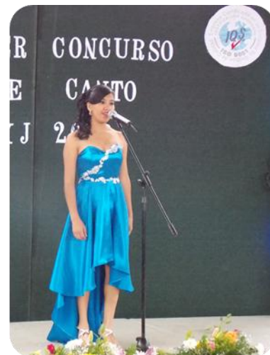
Concurso de Canto