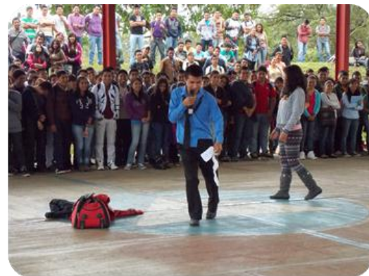
Squeche "Me quieres a pesar de lo que me dices"