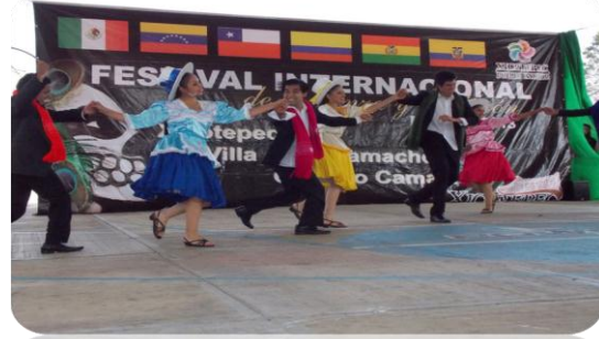
Festival Internacional de Danza y Tradición