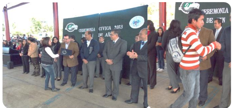
Primer y Segundo Lugar; Concurso de Calaveritas