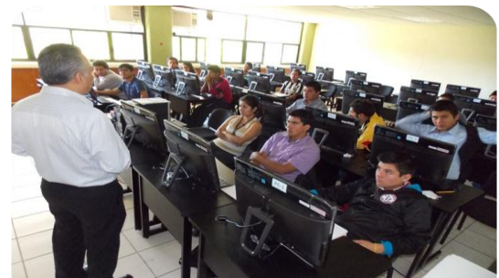
Curso de LABVIEW