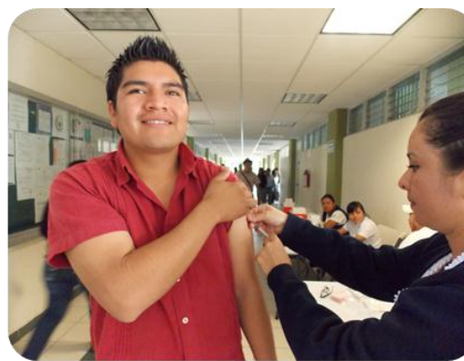
Campaña de Vacinación