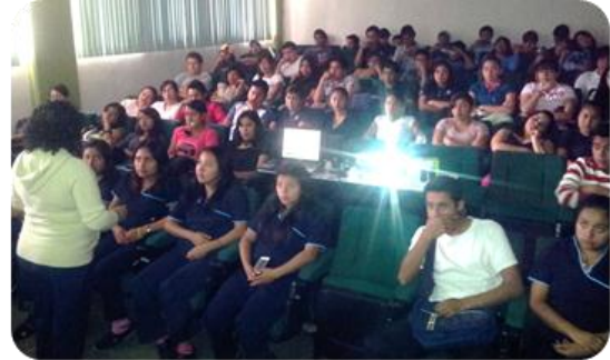
Conferencia denominada "Prevención de la discriminación hacia personas con capacidades diferentes"