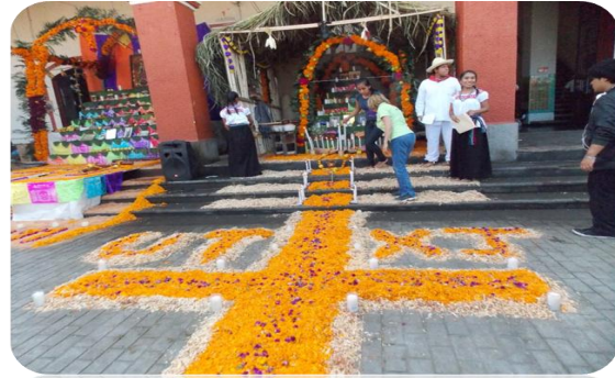
Concurso de Ofrendas.