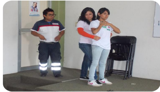
Curso de Primeros Auxilios