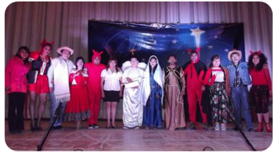
Pastorela "El Diablo Anda Suelto"