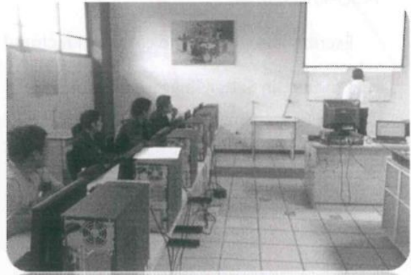
Curso de Electroneumática