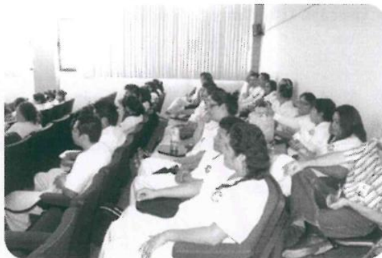
Conferencia Cáncer de Mama. Día Internacional de la Mujer