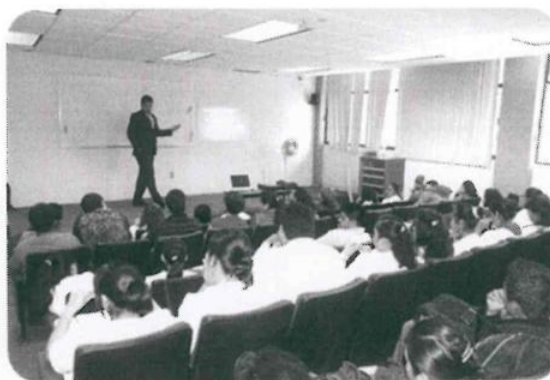
Conferencia Educación Financiera, Crisis Económica