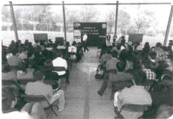
Conferencia Perspectiva de Género