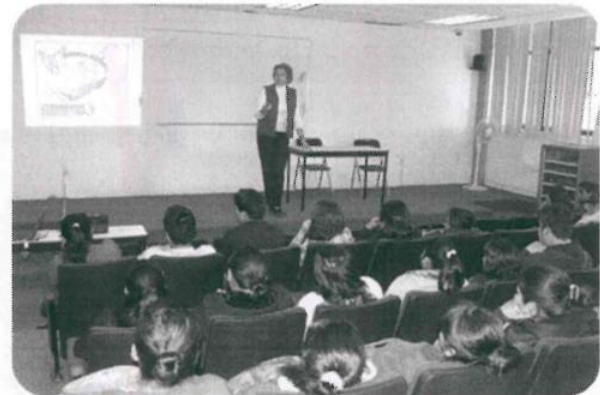
Cursos la Importancia de la Agricultura Sustentable