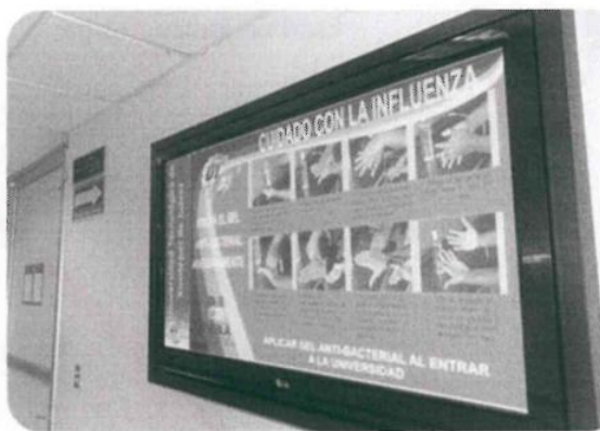
Campaña Medidas Prevención para el Contagio de Influenza