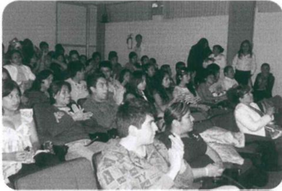
Conferencia Perspectiva de Género

En el mes de Marzo se realizó la 4.- Conferencia "Perspectiva de Género", se realizó la 5.- Conferencia Cultural "Prevención del Delito y Trata de Personas" y 6.- la "Conferencia Filósofo de Güemez". Beneficiando con estas actividades a 1143 mujeres y 1023 hombres.