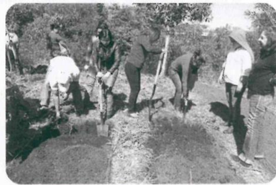
La mujer en la Agricultura