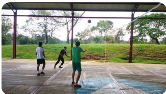
Torneo Interno de Voleibol Varonil