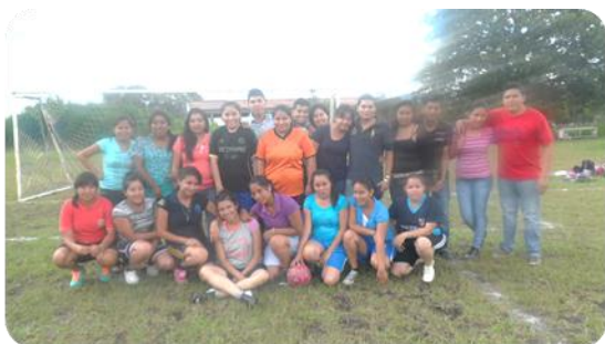
Cuadrangular de Futbol Femenil

En el mes de Agosto se organizaron los siguientes torneos "Cuadrangular de Fútbol Femenil", "Torneo Interno de Voleibol Varonil", "Torneo Interno de Voleibol Femenil", así mismo, en el mes de septiembres se organizó el "Torneo Interno de Futbol Sala Varonil". Beneficiando con estas actividades a 233 hombres y 56 mujeres, con los siguientes rangos de edades: 0-18: 85 beneficiados/as, 19-30: 201 beneficiados/as, 31-40: 3 beneficiado/a.