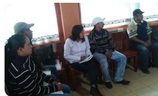
Cursos "Primeros Auxilios- Picaduras de Animales Venenosos"