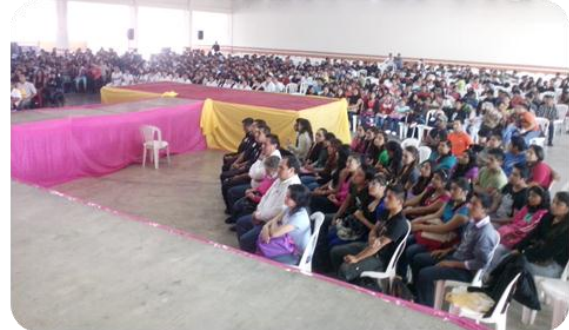
"Concierto Conferencia Escuela Valor"