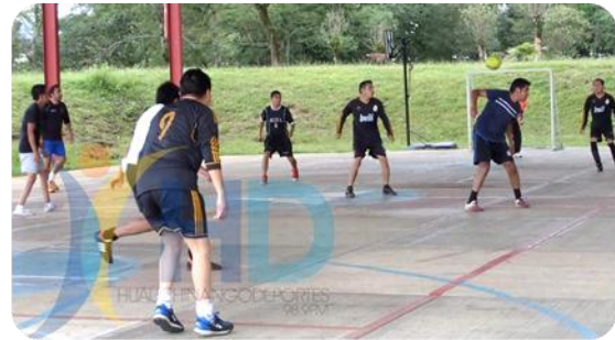
Torneo Interno de Futbol Sala Varonil