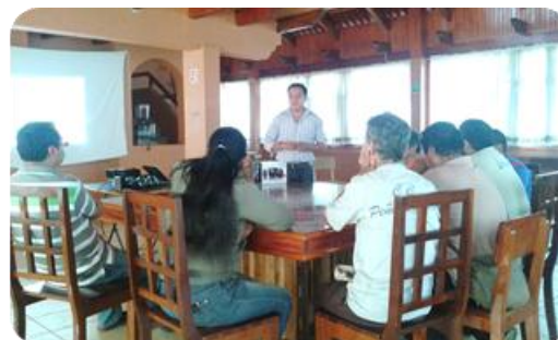
Cursos "Medio Ambiente"