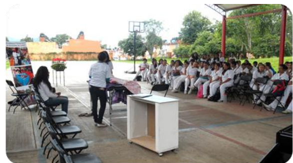
"Obra de Teatro Un PasoMás"