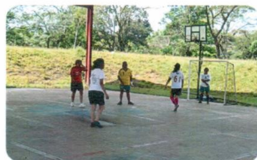
"Cuadrangular de Fútbol rápido rama femenil"