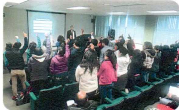
"Problemas en el Noviazgo"