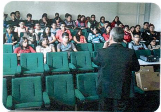
"Valores en el Trabajo: Liderazgo e Innovación"