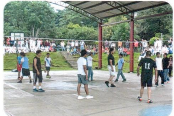
"Torneo de Voleibol Varonil"