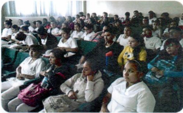
Platica sobre trastornos de la Alimentación "Me quiero, no me destruyo"