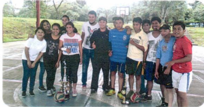
"Torneo de Voleibol Femenil"

Actividad 3.2 Organizar 30 eventos culturales y de salud que fomenten el desarrollo integral de los alumnos/as.