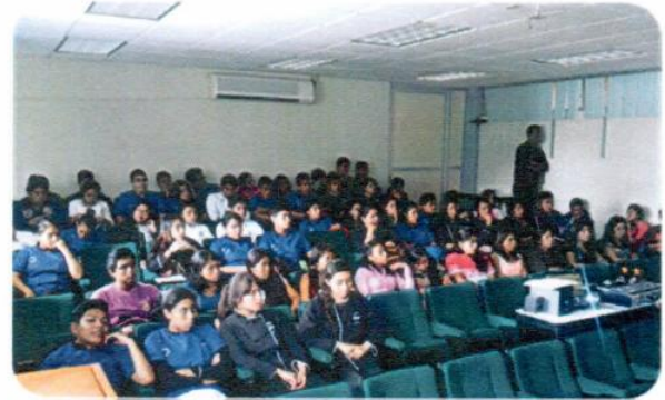
“Dúo de Conferencias del "Delito de Trata de Personas"”