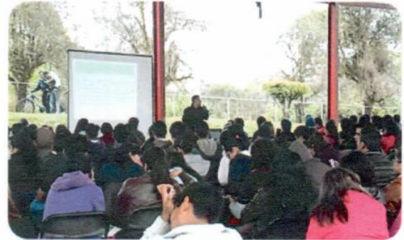
“Campaña de información y aplicación de Métodos de Planificación Familiar”