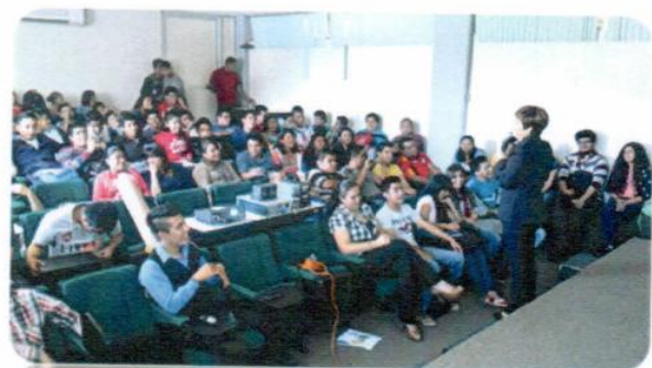
"Actitudes para el desarrollo del talento humano"