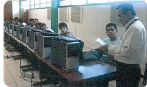
Cursos "Electroneumática Febrero"