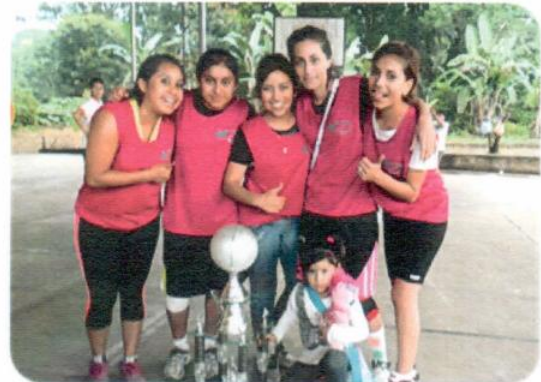
"Torneo de basquetbol Femenil"