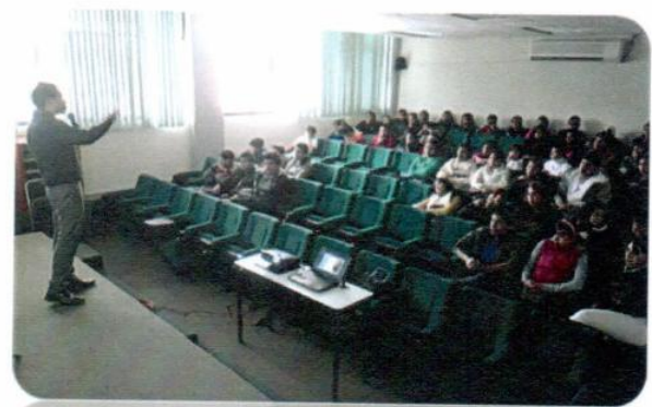
"Valores Humanos: Respuesta humana en el ámbito sexual"