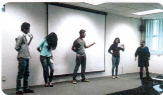
“Campaña de prevención de violencia en la adolescencia "Te quieres o te amas"”