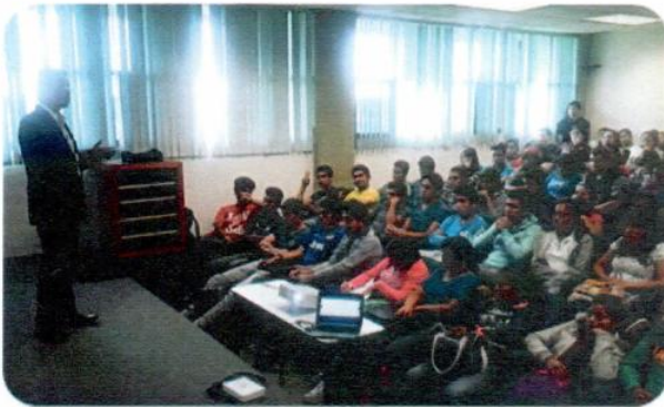
"Campaña día internacional sin tabaco"