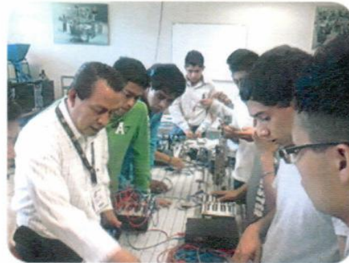
Cursos "Electroneumática Marzo"