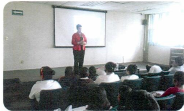
Campaña sobre hábitos dietéticos-higiénicos "Alimenta tu bienestar"