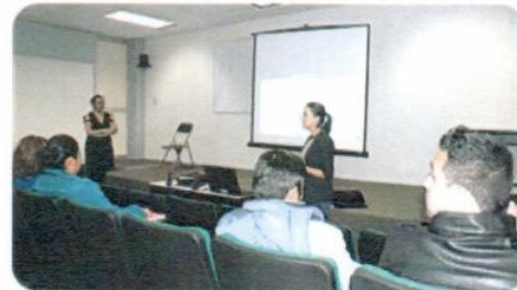
"Inducción al Modelo de Equidad de Género"