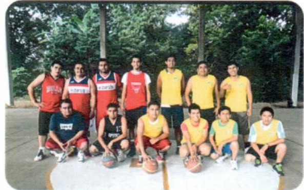
"Torneo de basquetbol varonil"