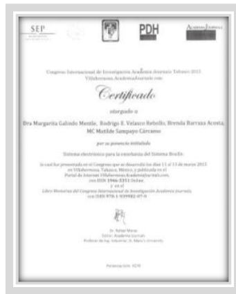
“Sistema Electrónico para la enseñanza del Sistema Braille”