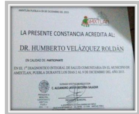
“1er. Diagnóstico Integral de Salud Comunitaria”