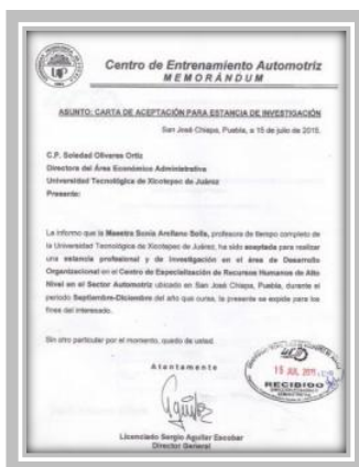
“Estancia de Investigación en Audi”