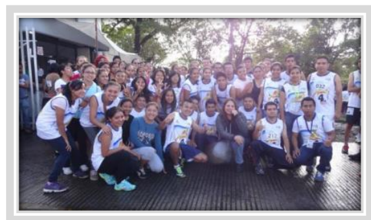
“Carrera Atlética UTXJ”