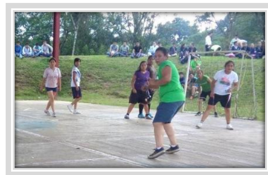
“Torneo de Fútbol Sala Femenil”