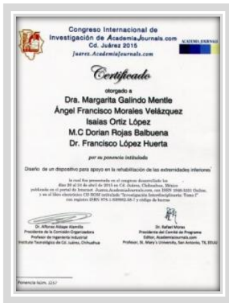
“Congreso Internacional de Investigación, Academia Journals en Tecnologías Estratégicas”