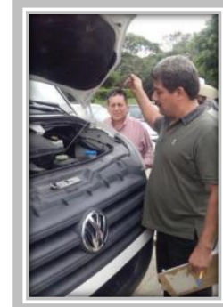
Curso Operación de Autobús Urbano