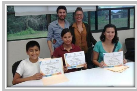
Cursos "Inglés Básico"