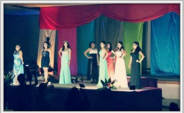
"Certamen Chica UTXJ 2015"