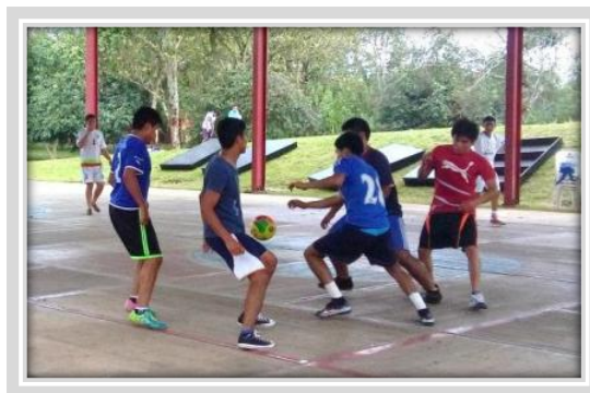
“Torneo de Fútbol Sala Varonil”