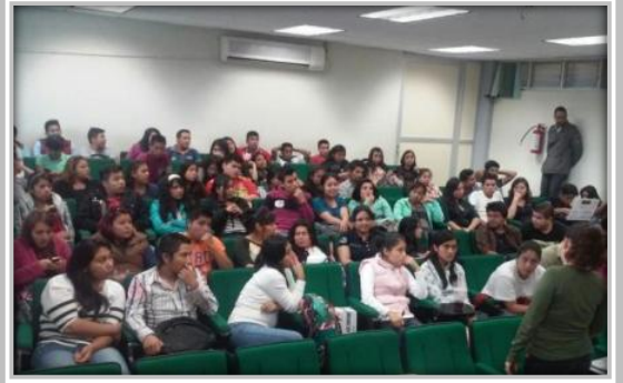
"Conferencia de Concientización de Reciclaje "