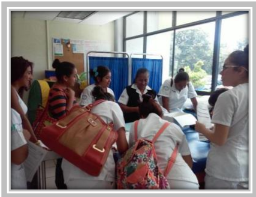
“Campaña de Estudios de Papanicolaou”