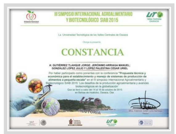
“Simposio Internacional de Agrobiotecnología”