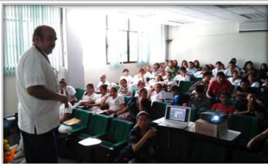
Conferencia de "La Cosmovisión Indígena sobre el Día de Muertos"