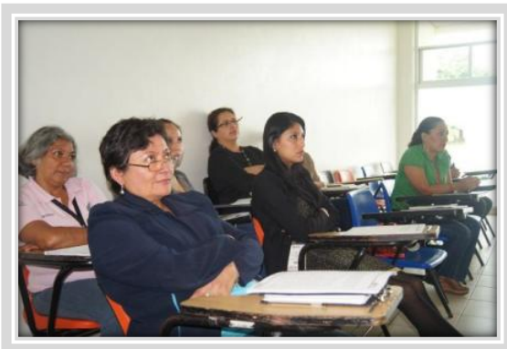
"Sensibilización a la No violencia"

Para diciembre se tiene programada la realización de un curso de Manejo del Estrés y la elaboración y difusión de un folleto del MEG entre la comunidad universitaria con el fin de concientizar sobre la equidad de género y evitar la discriminación y con estas acciones lograr la meta establecida.