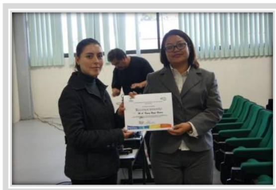
"Sensibilización a la No violencia"