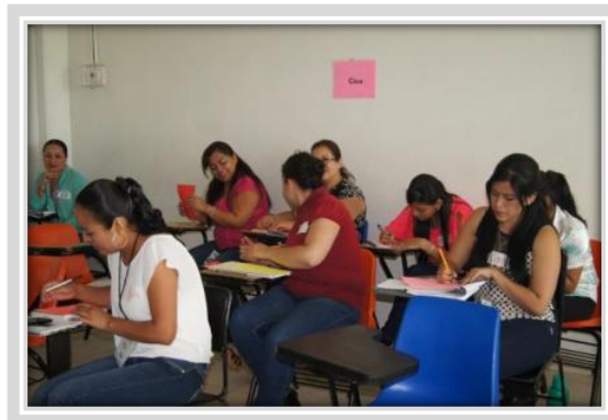
"Perspectiva de Género"