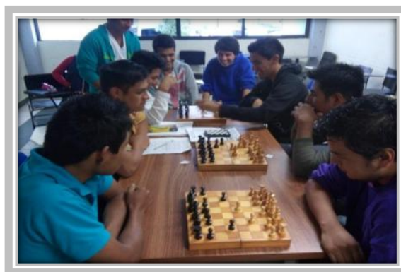
“Torneo de Ajedrez”

Actividad 3.2 Organizar 30 eventos culturales y de salud que fomenten el desarrollo integral de los alumnos/as.