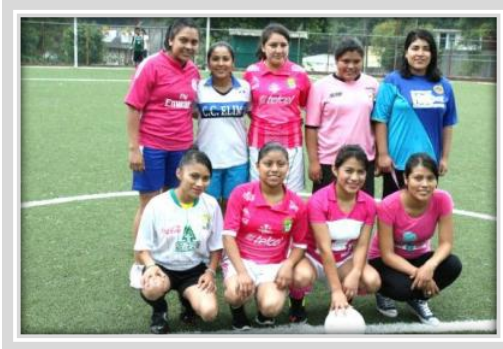
“Torneo de Fútbol Siete Femenil”

Beneficiando a 412 hombres y a 308 mujeres, en los siguientes rangos de edades: 0-18: 256 beneficiados/as, 19-30: 458 beneficiados/as, 31-40: 3 beneficiados/as, 41-50: 1 beneficiados/as y 2 de más de 50.