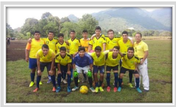
“Cuadrangular de Fútbol Soccer de IES”