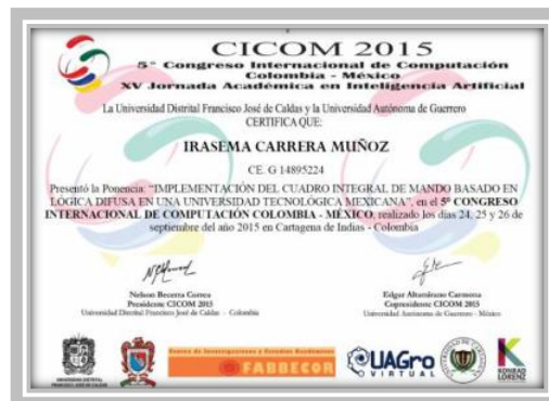
“Implementación del cuadro integral de mando”