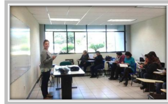
Curso de Preparación de Herramientas TOEFL