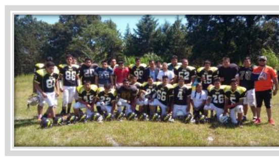
“Encuentro de Fútbol Americano”