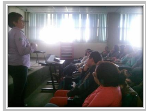
“Conferencia sobre Trastornos de la Alimentación”