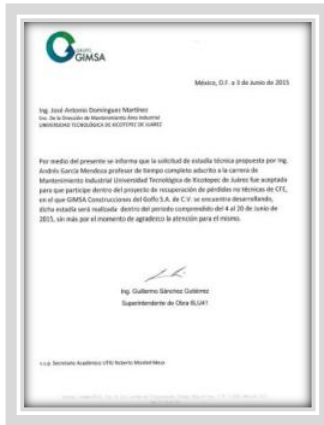
“Estadía técnica en Grupo GIMSA”