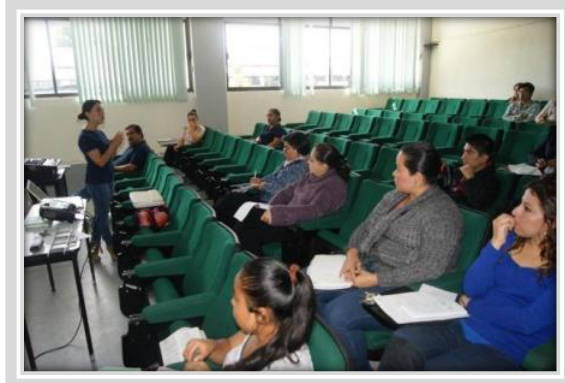
"Inducción al modelo de equidad de género"