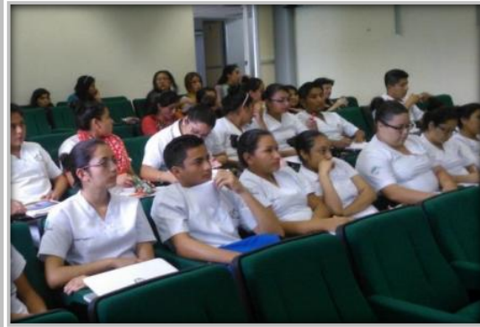
"Conferencia de Promover el Valor de la Responsabilidad "