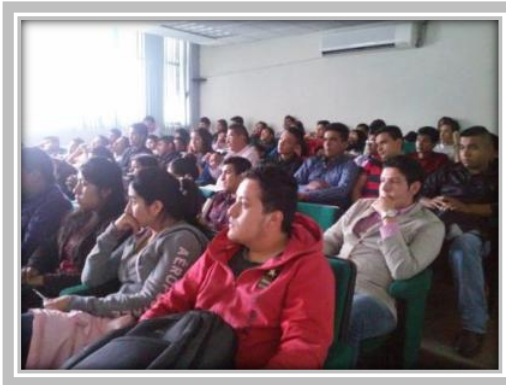
“Platica de Adicciones - Tabaquismo”