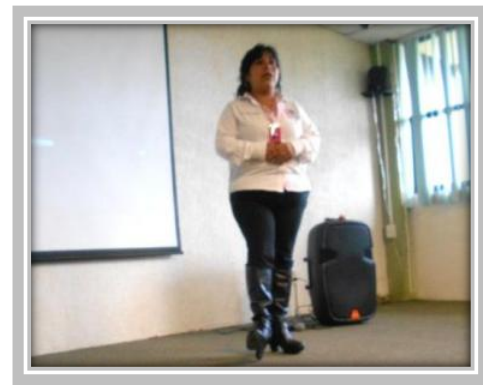
“Prevención de Violencia”