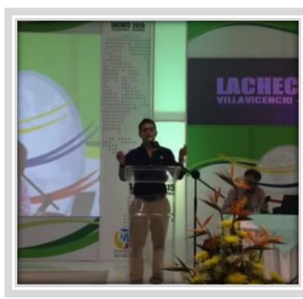
“Red Internacional de Cooperación Académica”