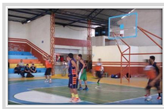
“Cuadrangular de Básquetbol de IES”