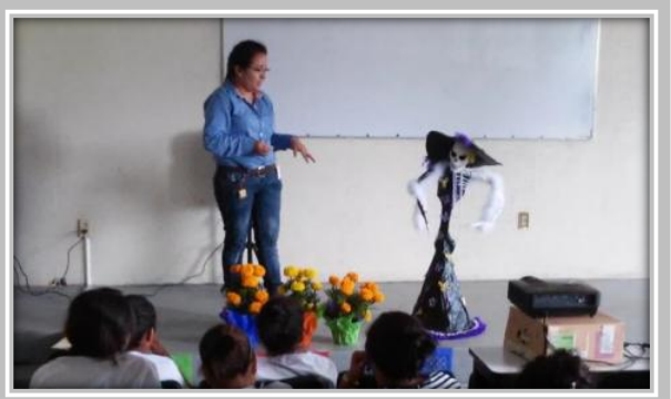
"Concurso de Catrinas Recicladadas "