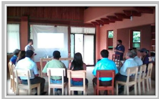
Curso Ambiente en la Empresa