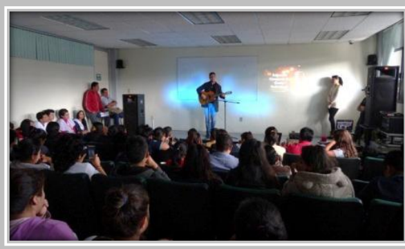
"Concurso de Canto"