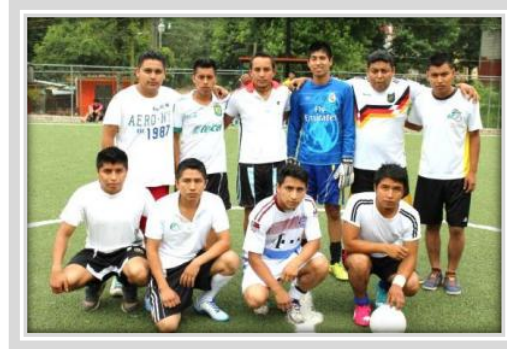
“Torneo de Fútbol Siete Varonil”