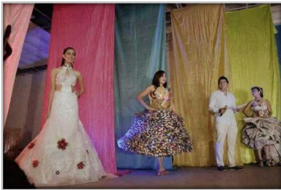
"Concurso de Vestidos Bio-Creativos"