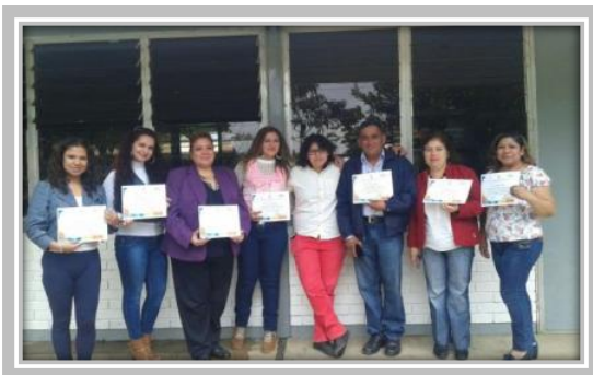
Curso de Inglés Intermedio Avanzado