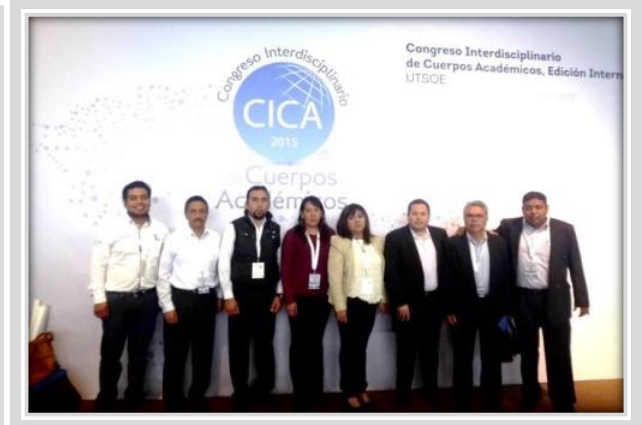
“Congreso Internacional de Cuerpos Académicos”