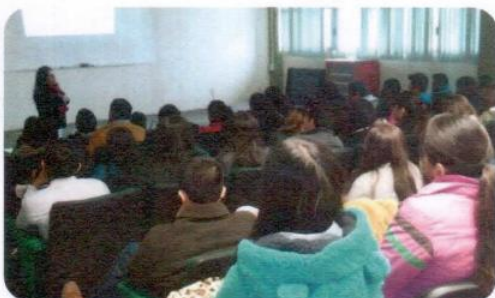
"Inducción al Campo Laboral"