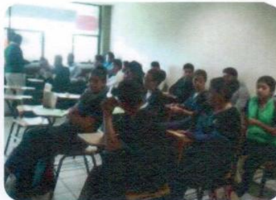
"Campaña Hábitos higiénico-dietéticos"