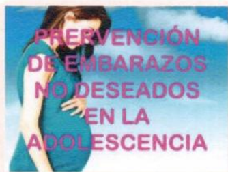
"Campaña de Prevención de Embarazos"