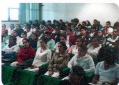
"Plática Prevención de Cáncer de Mama"