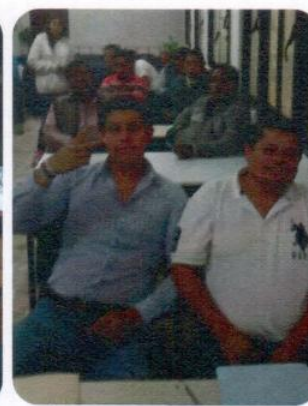
Certificaciones "Certificación para Autobús Urbano, Van y Taxi"