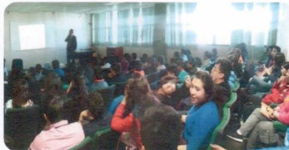
"Conferencia del día del Amor y la Amistad"

Actividad 3.1 Integrar a 1309 estudiantes en eventos deportivos para contribuir a su fortalecimiento físico e integral.