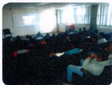
"Las tortugas pueden volar"

La meta fue superada debido a que se adelantaron actividades con el fin de cubrir un número mayor de estudiantes ya que en el siguiente periodo los estudiantes de TSU realizan su estadía.