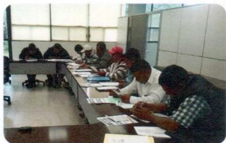
Curso "Operación de Transporte Público"

Por disposiciones de agenda del facilitador se adelantaron dos cursos que estaban programados en el siguiente trimestre, por lo cual la meta se vio superada.