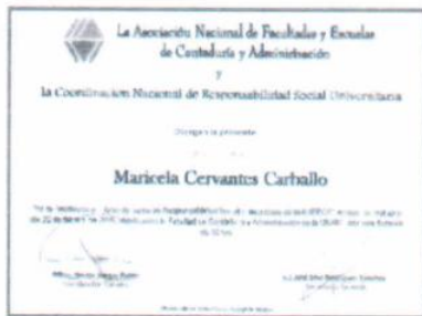
"Pares académicos de responsabilidad social universitaria"