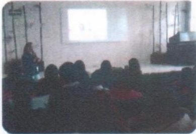
"Inteligencia emocional para el éxito"