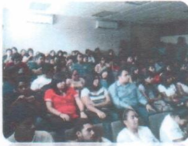
"Día internacional sin tabaco"