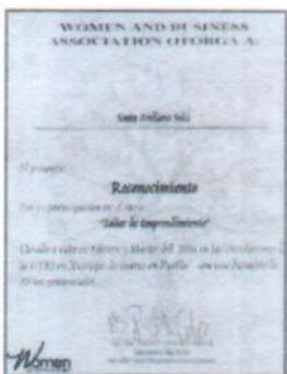
"Taller de emprendimiento"