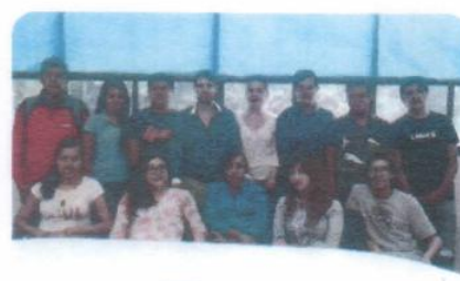
“Curso de Inglés Básico”