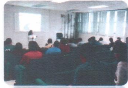
"Taller de Formando Hábitos"