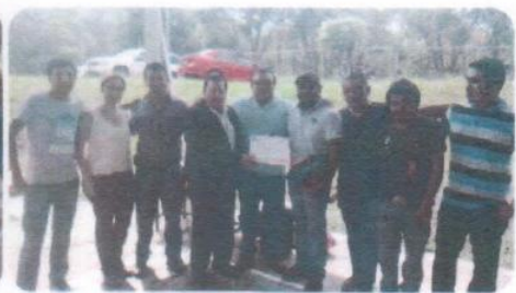
"Torneo Interno de Futbol Sala Mixto"