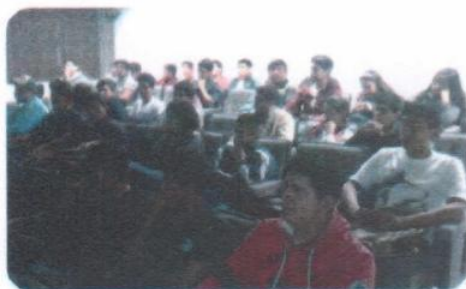
"Violencia de género. ¿De qué lado estamos?"

La meta fue superada debido a que se adelantaron actividades con el fin de cubrir un número mayor de estudiantes.