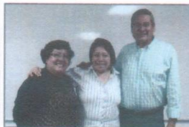
"Estadística inferencial con SPSS"