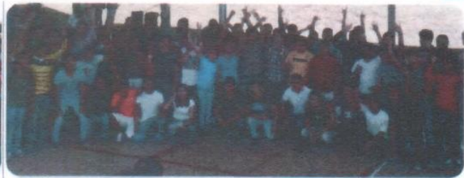
2da. Activación física masiva "Mueve tus alas gorrión"