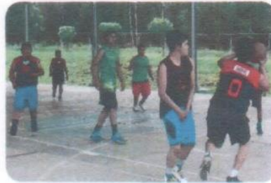
"Torneo de Básquetbol Varonil"