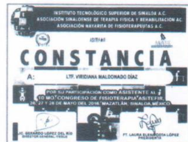
"Congreso de fisioterapia"