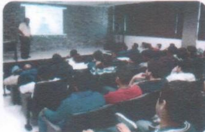
"Origen Cosmogónico del Festejo de la Xochipila"