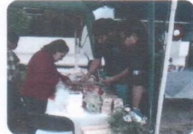
"Presentación de Artesanías"