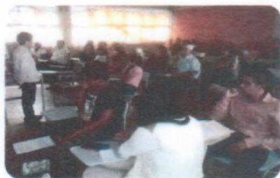
“Curso de Inglés Básico”

No se llevó a la meta debido a que unos cursos que se tenían programados para este trimestre se realizaron en el anterior, por lo que no se vio afectado el avance general.