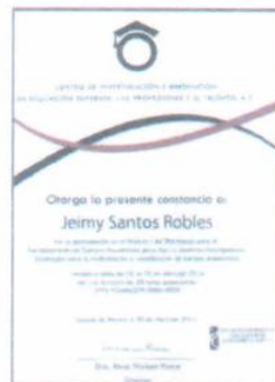
"Estrategias para la conformación de CA"