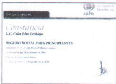
"Seguro social práctico"

Nota los reconocimientos faltantes aún no son enviados por parte de la empresa capacitadora, por lo cual solo se anexan fotografías del curso.