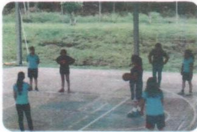
"Torneo de Básquetbol Femenil"