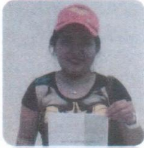
"Concurso de Ensayo UTXJ 2016"