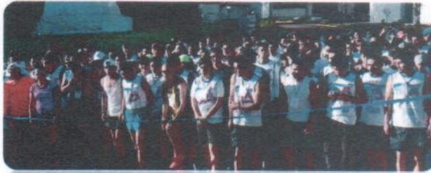
Carrera Conmemorativa del 25° Aniversario de las UT's.