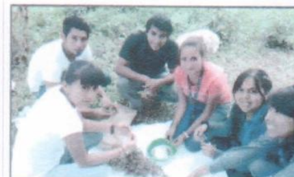
"Seminario de Sistemas"