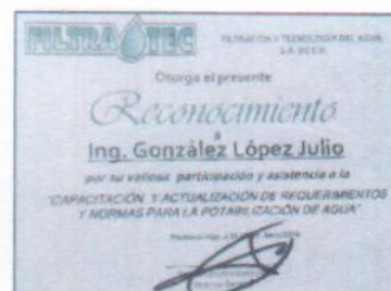
"Requerimientos y normas para la potabilización de agua"