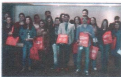
"Capacitación a docentes de francés por la editorial CLE"