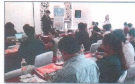
"Congreso transforming knowledge"