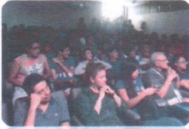
"El Soplador de Estrellas"