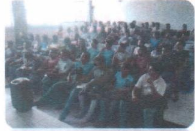
"Carranza en la Sierra Norte de Puebla"