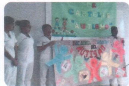
"Concurso de Carteles sobre Autismo"