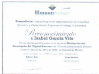
"Evaluación del desempeño del capital humano"