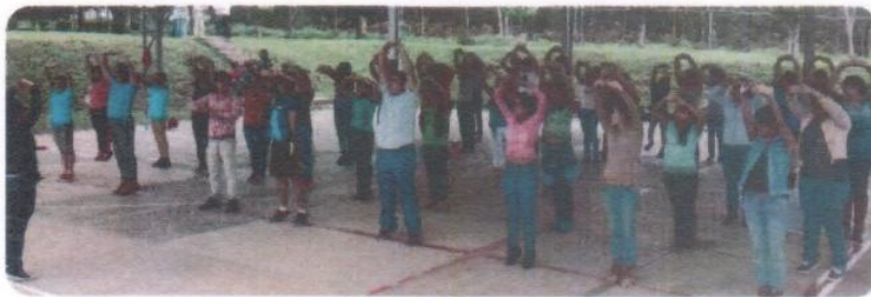
1era. Activación física masiva "Mueve tus alas gorrión"