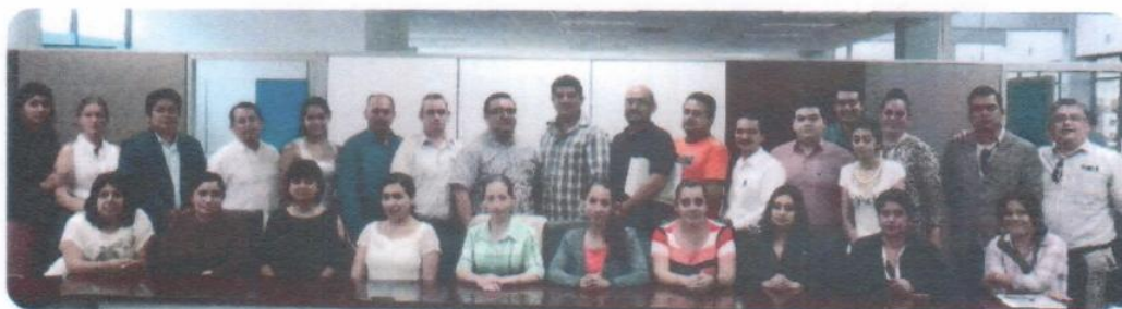
“Taller de Cultura Financiera”