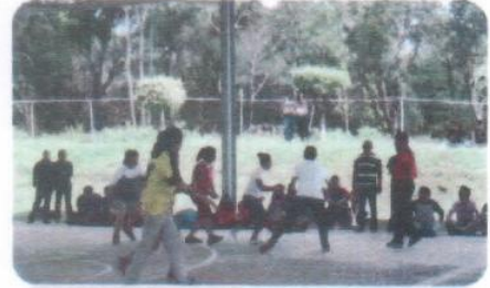
"Torneo Interno de Básquetbol Mixto"