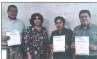
"Curso de COI"