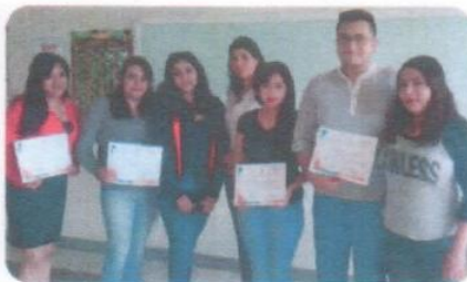
“Curso de Inglés Pre-Intermedio”