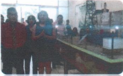
"3ra. Feria de Innovación y Tecnología"