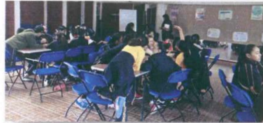
"Simulador de Negocios"