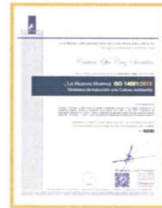
"La Nueva Norma ISO 14001:2015"

Por motivos de agenda de la empresa capacitadora dos cursos se reprogramaron para el siguiente trimestre, por lo cual, la meta no se cumplió.