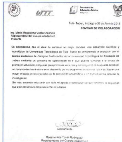
"CA Energías Sustentables"