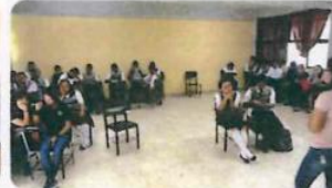
"Miguel Hidalgo y Costilla"