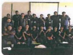
"Donación de Medicamentos"