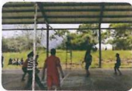
"Torneo de Botibol - Voleibol"