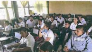
"Sor Juana Inés de la Cruz"