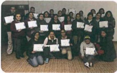
"Simulador de Negocios"