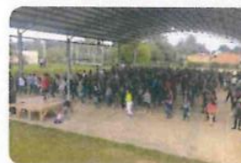
"1era. Activación Física"