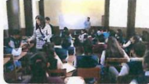
"Miguel Hidalgo - Huauchinango"