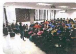
"Conferencia Amor, Relaciones Tóxicas"