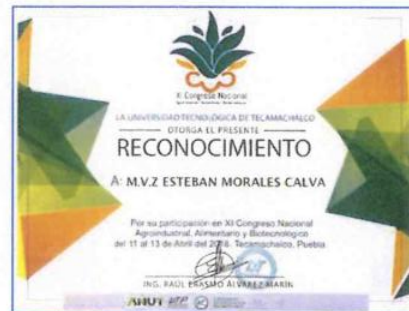
"Congreso Nacional Agroindustrial Biotecnológico"