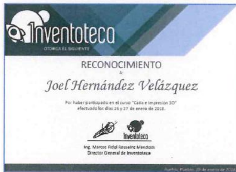
"Catia Impresión 3D"