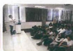
"ETS - Planificación Familiar"