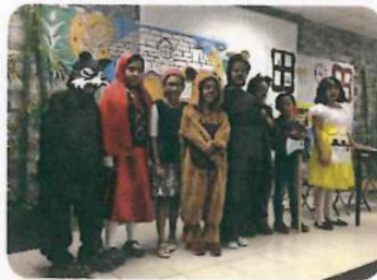
"Inglés Pre - Intermedio"