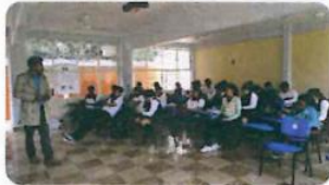
"Manual Ávila Camacho"