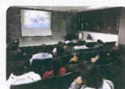
"Documental 5 de mayo"