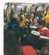
"Día de la niña y del niño"