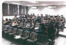
"Proyección - Horizonte Profundo"