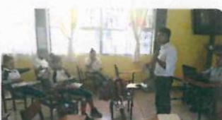
"21 de mayo"