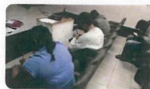
"1er. Taller y Plática Formando Hábitos"