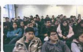
"Hábitos Higiénico - Dietético"