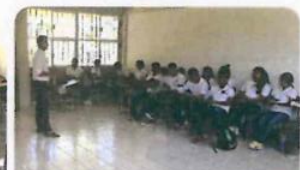
"EMSAD Plantele Tlaolantongo"