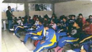
"Rafael Cravioto Pacheco"