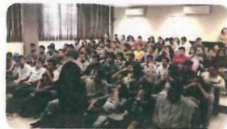
"Inducción al Campo Laboral"