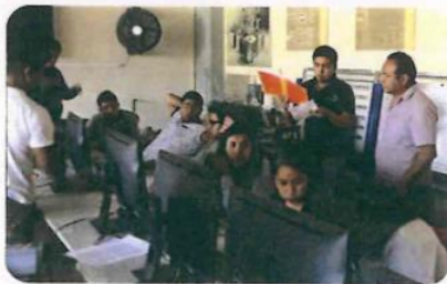
"Regularización de Neumática e Hidráulica"