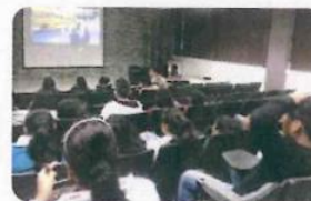
"Cine - Debate Wonder"