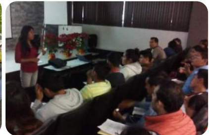
Taller de Lectura y Comprensión