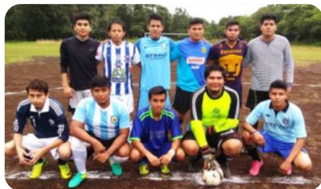
Torneo Fútbol Soccer Varonil