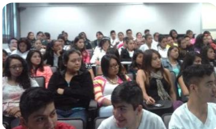
Plática cáncer de Mama