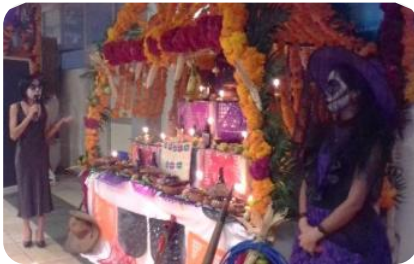
Concurso de Altares