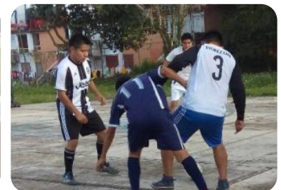
Torneo Fútbol Sala Varonil