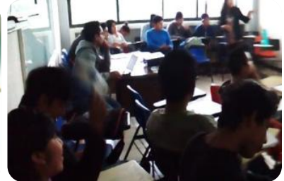
Formando Hábitos de Estudio