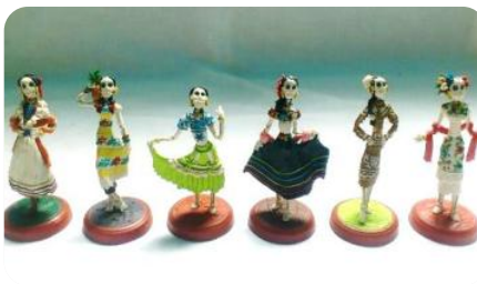
Concurso de Fotografía Digital