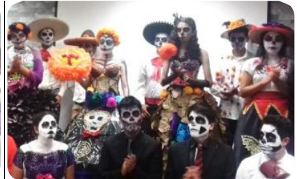
Concurso de Catrinas y Catrines