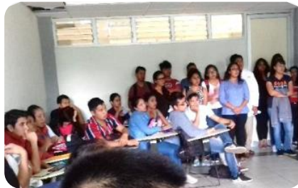
Plática del día de muertos