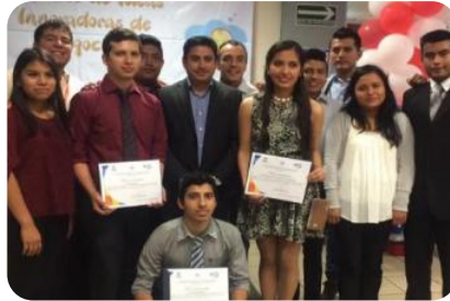
13 Concurso Institucional de Ideas