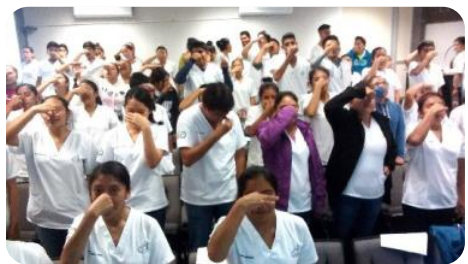
Plática Desarrollo de Habilidades