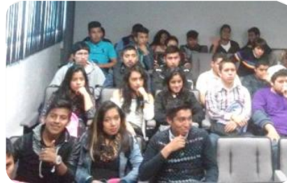
Plática Desórdenes Alimenticios