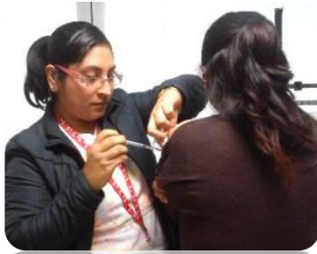
Aplicación de biológico