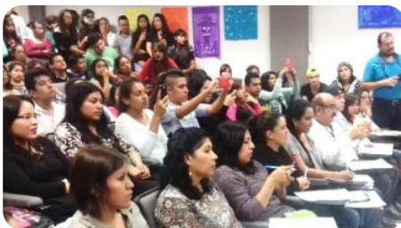
Concurso de Papel Picado