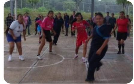
Torneo Fútbol Sala Femenil