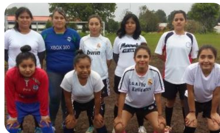
Torneo Fútbol Soccer Femenil